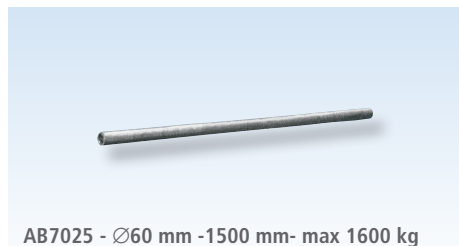
AB7025 - \varnothing 60 mm -1500 mm- max 1600 kg