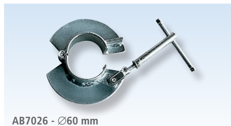
AB7026 - \varnothing 60 mm